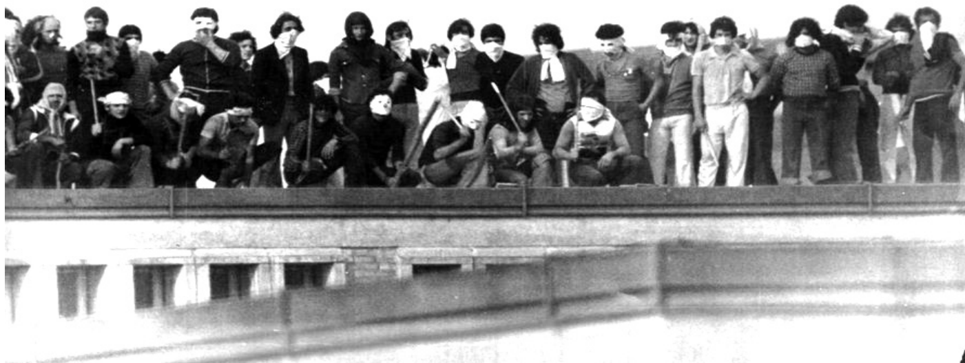
Rivoltosi sul tetto del carcere di Rebibbia, Roma, anni '70