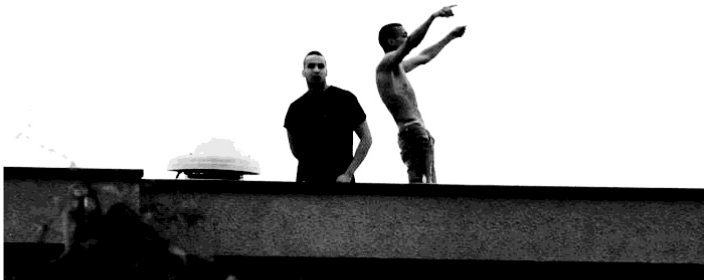
Rivolta al carcere di Biella. ottobre 2015.

'Materiale interessante' - Sante Notarnicola edizioni della battaglia, 1997